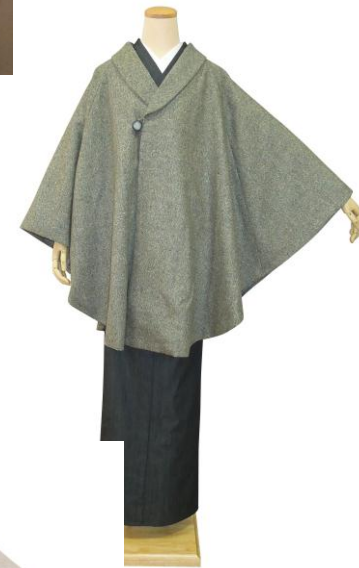
カラーネップポンチョ ¥39,900