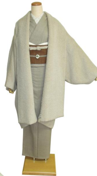
モヘアシャギーショートコート ¥94,500