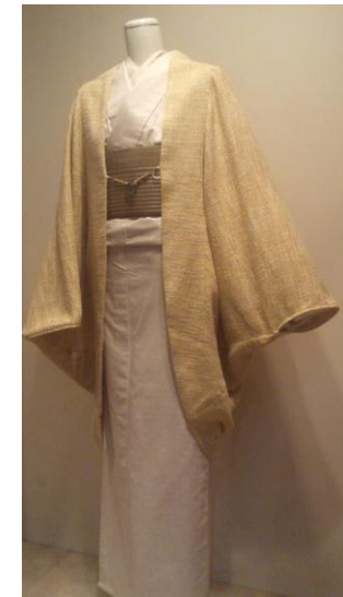
今年も人気の モモンガコート ¥29,400