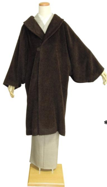
スーリーアルパカ ショールカラーコート ¥136,500

きものせいたがセレクトしたコートのご紹介です。 ちょっとおしゃれなコートをお探しの方にぴったりです。 もちろん、掲載柄以外にもシンプルなカシミア100% のコートほか多数ございます。 ぜひ、この機会にご来店お待ちしております。